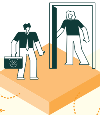
Energieausweis-Ersteller:in vor Ort