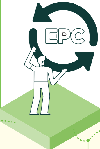
Buchung einer Wiederbewertung