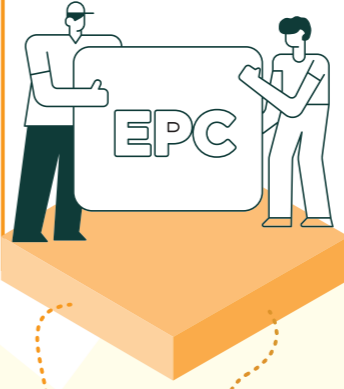
Energieausweis offiziell ausgestellt