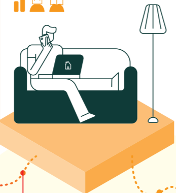
Beauftragen einer Berechnung